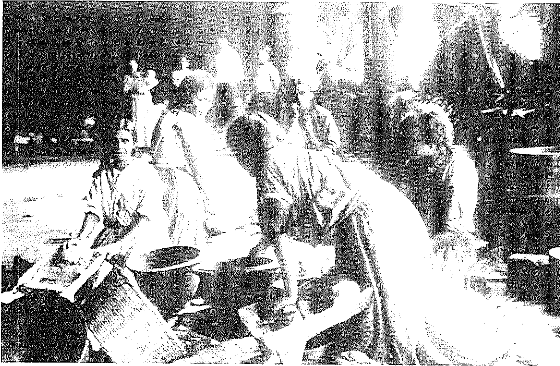
Figura 3. Mujeres en metate. Disponible en

HONORABLE CONGRESO DEL ESTADO LIBRE Y SOBERANO SAN LUIS POTOSÍ