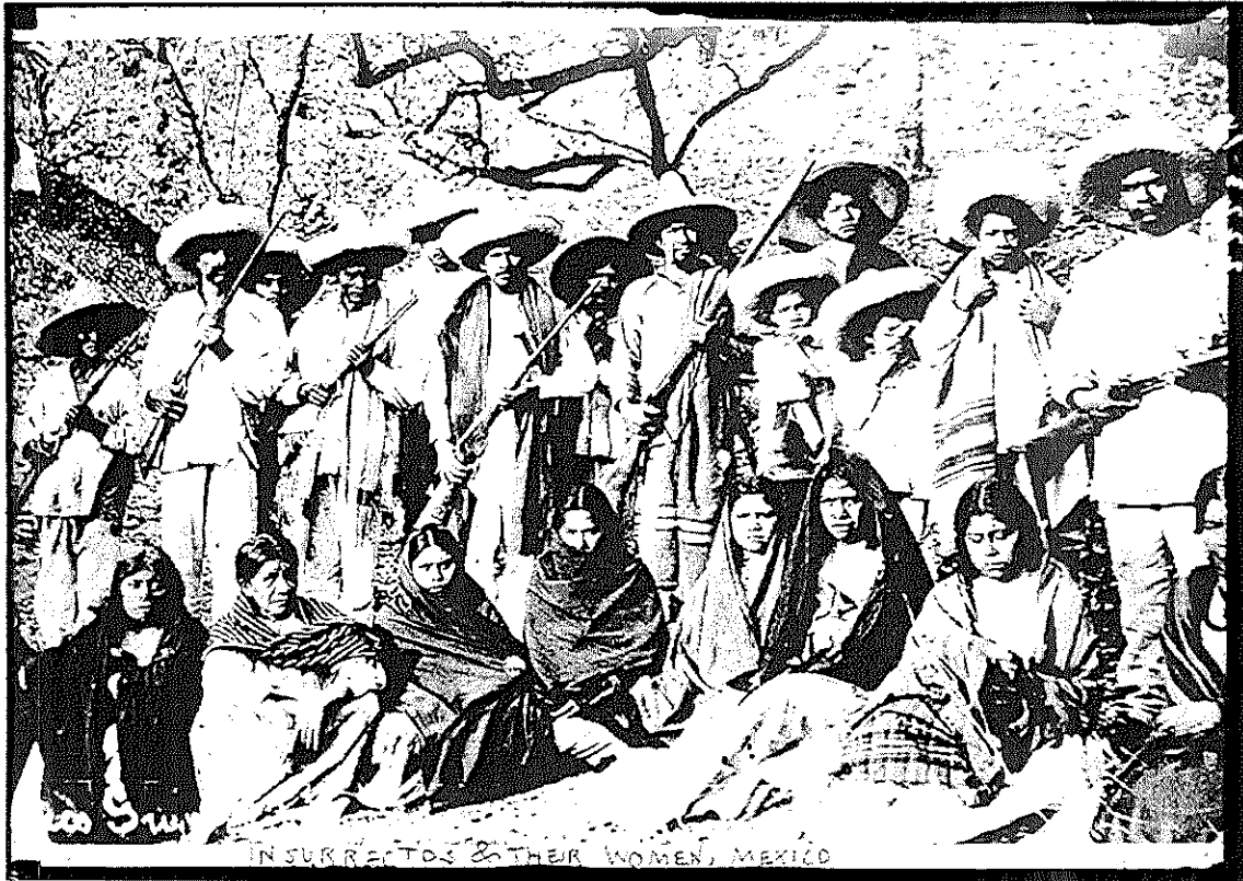
Figura 4. Mujeres revolucionarias. http://culturacolectiva.com/adelitas-un-riflen-bien-ajustado-al-rebozo/

HONORABLE CONGRESO DEL ESTADO LIBRE Y SOBERANO SAN LUIS POTOSÍ