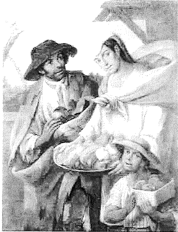
Figura 2. Miguel Cabrera (ca. 1695-1768)

HONORABLE CONGRESO DEL ESTADO LIBRE Y SOBERANO SAN LUIS POTOSÍ